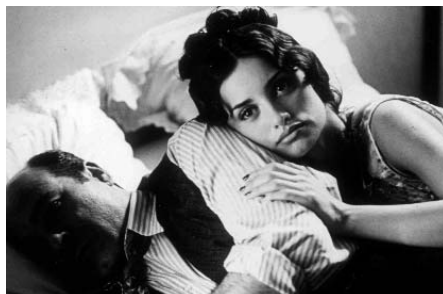
La niña de tus ojos de Fernando Trueba

La simple enumeració de les seves amistats i tertulians també afegeix força informació sobre Azcona: la varietat de gents, d'actituds polítiques