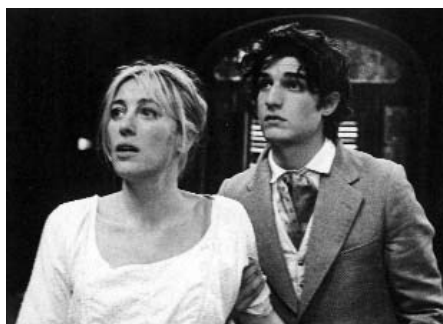
Actrius de Valeria Bruni Tedeschi

La programació de la 16a Mostra s'organitza en diversos apartats, alguns habituals com la secció Panorama , que inclou les ficcions i els documentals més recents, i la de les Pioneres , orientada a recuperar el treball d'aquelles realitzadores que han estat poc reconegudes per la història del cinema. En la mateixa línia de recuperació del treball aportat per les dones, presentem tres pel·lícules de Larisa Shepitko, una de les cineastes més importants del nou cinema soviètic de la dècada dels 60 i 70, en la secció Retrospectiva . Amb el títol Que se n'ha fet de la revolució? , hem programat 5 documentals que mantenen una mateixa actitud crítica davant les utopies proposades per les diverses revolucions de què tracten. La distància entre el que s'esperava aconseguir i els resultats obtinguts no serveix de coartada per a la nostàlgia ni per a l'escepticisme, sinó per interrogar-nos sobre el mite de la revolució que s'havia construït al voltant de determinades pràctiques polítiques. En l'apartat Monogràfic presentem dues obres de Gaëlle Vu, una realitzadora nascuda a França de