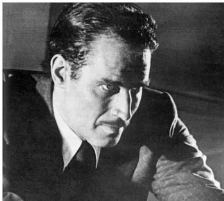
Touch of Evil d'Orson Welles

Volem recordar la figura de l'actor Charlton Heston, finat recentment, amb dos dels seus films més interessants que a més l'allunyen de la imatge habitual d'heroi en tecnicolor que tenim tots al cap: Touch of Evil (Orson Welles, 1958), on tingué un paper destacat en el desenvolupament del projecte, i Ruby Gentry (King Vidor, 1952), una de les seves interpretacions més reeixides.