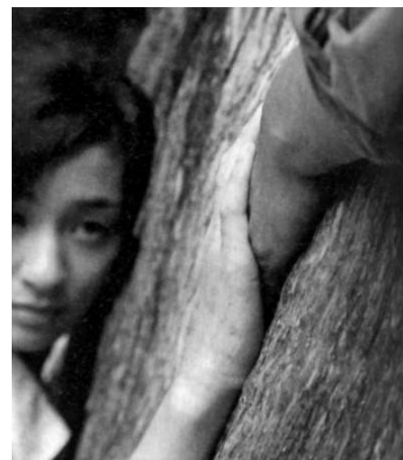
El bosque de luto de Naomi Kawase

A Mirades de Kabul , s'hi inclou el treball de dues realitzadores que apunten a d'altres possibilitats de les imatges com a instruments d'intervenció, en aquest cas mostren les capacitats de la representació per evitar les rígides normes imposades a les dones en la societat afganesa. En la secció Etnografies experimentals , Virginia Villaplana i Montse Romaní ens proposen seguir la línia discursiva iniciada a la Mostra anterior sobre les aportacions de les dones a les recents narratius del videoassaig centrades en la politització dels relats de gènere i la construcció de subjectivitats.